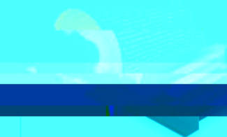
平形陶瓷包胶（用于改向滚筒）